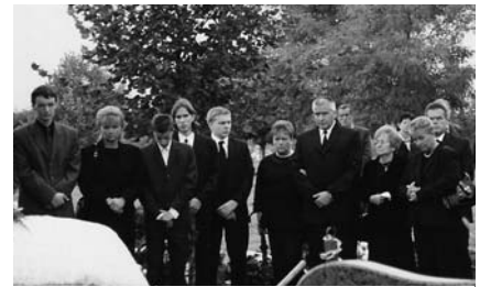
A gyászoló család

A búcsú legnehezebb perceiben fölharsantak a „trombiták”, és a Központi Énekkar énekei vigasztaltak bennünket.