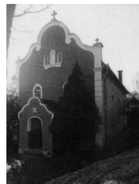
A felsőcsernakoni baptista imaház