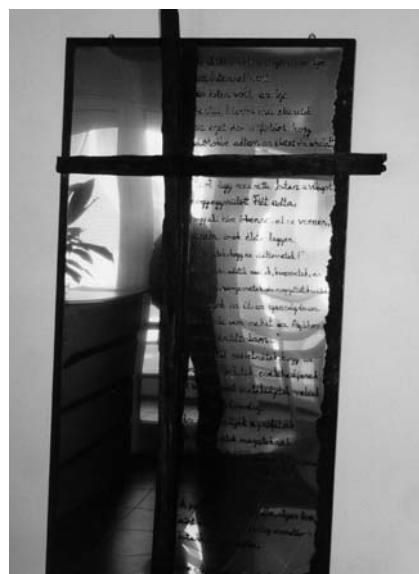
Horváth László szobrászművész „ régi keresztje” az 5 évvel ezelőtt átadott Benczúr utcai Missziói Központ előcsarnokában