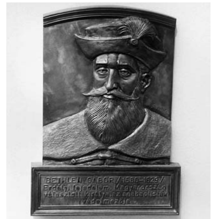
A Bethlen bronzportré a Millenniumi Emlékparkban

A Benczúr utcai Missziós Központban 2000. március 19-én adtuk át – az új épületkomplexum mellett – a Millenniumi Emlékparkot. 12+2 bronz dombormű emlékezteti a látogatót a baptista múltára, Bánkúti István szobrászművész alkotásai. A sorban második Bethlen Gábor (1580–1529) erdélyi fejedelem, Magyarország választott királya, az anabaptisták védelmezője. (A teljes szoborsor színes képeken látható 2000 karácsonyán megjelent „Ezredfordulók” c. könyvben.) „Bethlen Gábor és a baptisták” címmel a Baptista Levéltár kiadásában jelent meg 2003-ban egy különösen értékes tanulmány, valamint az Alvinci kéziratok (1623–1644) Zágoni Jenő gondozásában. Mindkét könyv megrendelhető szerkesztőségünk címén.