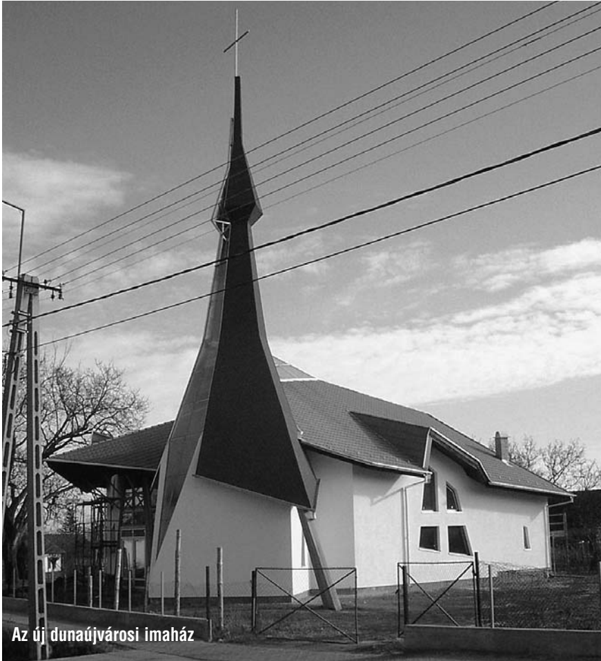
Az új dunaujvárosi imaház

2005. január 30-án meglátogattam a Dunaujvárosi Baptista Gyülekezetet. Vasárnap délután volt. Hideg, havas téli nap. Az Idősek Napközi Otthonában, ahol ideiglenesen tartják összejöveteleiket a testvérek, barátságos meleg és ragaszkodó szeretet fogadott. Lehetünk vagy húszan.