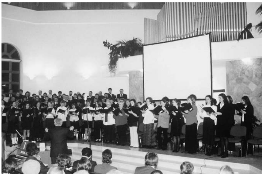
Az összevont kórus egy része

Amikor a Lélek gyümölcse ilyen gazdagon élénk kerül, és beszélünk sorban a szeretetről, az örömről, és sorolhatnám – és most magunk elé képzeljük a nem látható fát – akkor azt hiszem, mindnyájan megállapíthatjuk: igen, Isten azt szeretné, hogy egy gyümölcsös kertben, egy gyümölcsöző fa legyen a miénk, a baptizmus fája. Azt hiszem, hogy így a világszövetségi kongresszus előtt nagyon komolyan kellene azért imádkoznunk, hogy ne ez legyen az utolsó kongresszus. S nagyon komolyan kellene azért imádkoznunk, hogy azok a testvérek, akik úgy látják, hogy a világszövetség nem jó irányba halad, próbáljanak megtenni minden annak érdekében, hogy valami módon korrekció történjék. Mind a két oldalon talán szükség lenne annak a belátásra is, hogy félre kellene tenni bizonyos ellentéteket, olykor személyi ellentéteket annak érdekében, hogy a Szentlélek által gyümölcsöző egység kialakulhasson.