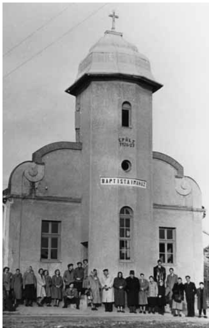
Albertirsai vendégek a berettyóújfalvai imaház előtt 1958-ban

A markoló munkája révén a tető cserepezése és faszervezete még jobban leszakadt. A területet körbevették, a forgalom elől elzárták, megközelíteni nem lehetett. A zuhogó esőben éjjel 3 óráig a polgárőrök, majd a gyülekezet néhány tagja felváltva őrködött a romok mellett. Ekkorra az egyszerű szemlélő által is látszott, hogy az imaház teljes mértékben használhatatlanná vált.