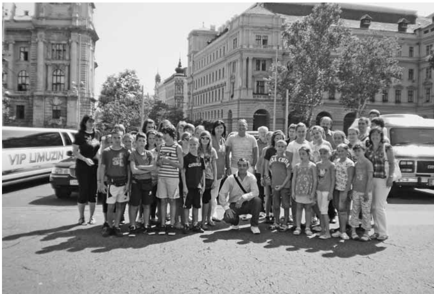
A Kossuth téren a limuzinokkal

Ilyen segítő felajánlás érkezett a Baptista Szeretetszolgálattól, amelynek köszönhetően szendrői és edelényi árvízkárosult gyerekek csoportja egy csodálatos élményekkel teli hetet tölthetett Ráckeveén és Budapesten.