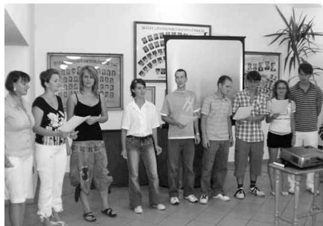
Erzsébeti fiatalok énekelnek a gyerekeknek

tunk meg kifejezetten a gyerekeknek, akik mellelleg késtek egy jó órát. Ennek én nagyon örültem, mert annál tovább kínozhattam a kis csapatot. Lett is eredménye, hiszen egyik éneket se füttyülték ki, pedig fel volt ajánlva számukra ez a lehetőség is.