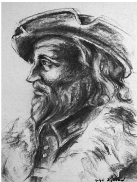
Hubmayer Baltazár 1481-1528

Schaffhausenba való visszatérésekor (1507-ben) Hübmaier friss lelkesedéssel jelentkezett egyetemi tanulmányaira, 1511. augusztus 1-én megkapta a baccalaureus biblicus minősítést. E fokozat megszerzése előtt dr. John Eck protezsáltja csupán egy év alatt szerezte meg a B.A. fokozatot az egyetemen, és 1510 őszén követte tanárát,