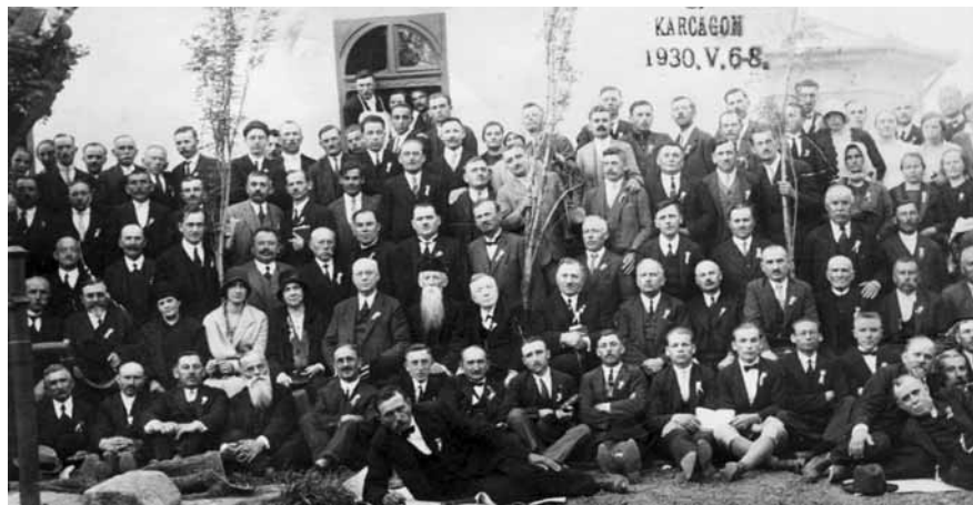
Országos közgyűlés Karcagon 1930-ban

Nem volt haragtartó. Kész volt hamar megbocsátani, és bocsánatot kérni. Ismerte Isten szeretetét, amit tovább is tudott adni. Egyszer megkérdezte egy hitben gyenge testvértől: azért jársz ritkán gyülekezetbe, mert félsz, hogy szeretni fognak? Nem véletlen, hogy kedves énekei közé tartozott: „A szeretet hatalmát áldom, mely Megváltómban megjelent...”