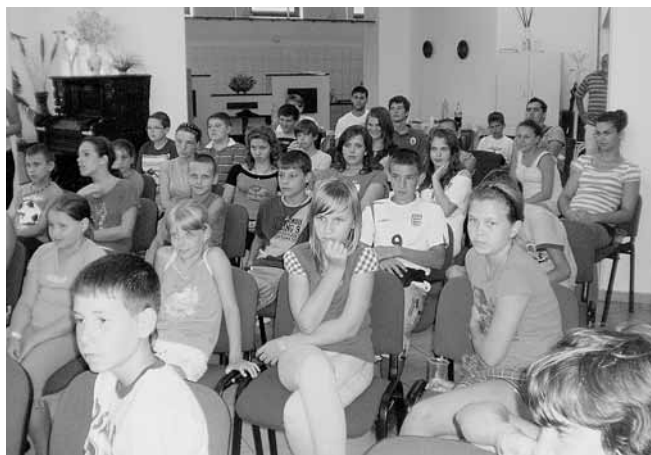
A pesterzsébeti imaház közösségi termében

ráadásul nem mi találtunk ki, csak egyszerűen mi olyanok vagyunk, akik még úgy csinálják, ahogyan kell. Közben megejtettük volna az éneklést is, ha nem tűnik el a férfiszólam. Félreértés ne essék, nem hagytak cserben, csak elmentek felpakolni a buszt azokkal a segélycsomagokkal, amik összegyűltek az imaházban. Mondjuk elég sokáig tartott nekik, tehát vagy ők voltak kevesen és túl sok volt a csomag, vagy nagyon lassan dolgoztak és óriási kerülővel jöttek be az udvarról. Mindegy, az a fő, hogy a busz is fel lett pakolva minden jóval, az énekek is el lettek énekelve ügyesen, okosan. Megnéztünk a szókepusztai gyermektáborban készült