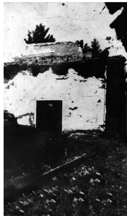
Biharugrai imaház romokban, 1945

Így aztán közrefogott a két atyafi és mentünk a templommal ellenkező irányba, az imaház felé. Velünk szemben pedig jöttek a templomba igyekvő asszonyok. Én úgy mentem szégyenkezve a két testvér között, mint egy halálraítélt. Izzadtam, szinte lefőttem, mire az imaházhoz értünk. A templomba igyekvők nem kis ámulatára tértem be az imaházba. Ott alig vártam, hogy vége legyen az istentiszteletnek, sietve elhagytam a helyiséget, nehogy hazafelé is a hívőkkel lássanak együtt a templomból hazatérők. Azonban ez volt a tűz-