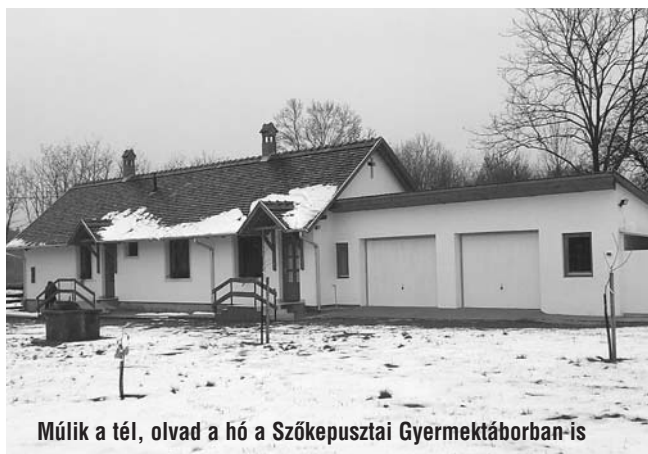
Múlik a tél, olvad a hó a Szőkepusztai Gyermektáborban is