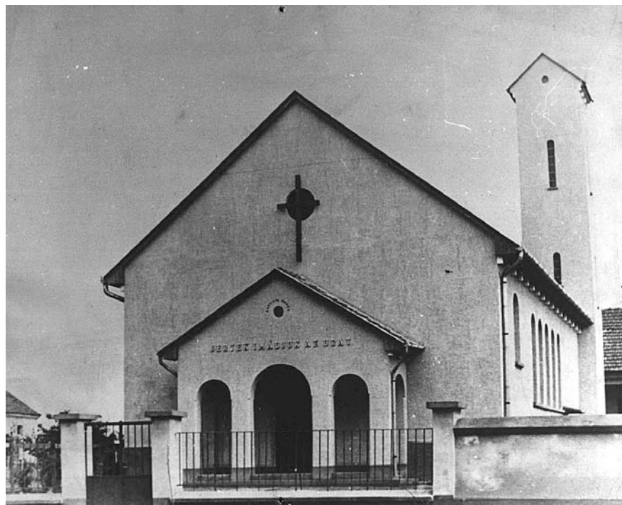
Biharugrai új kápolna, 1948