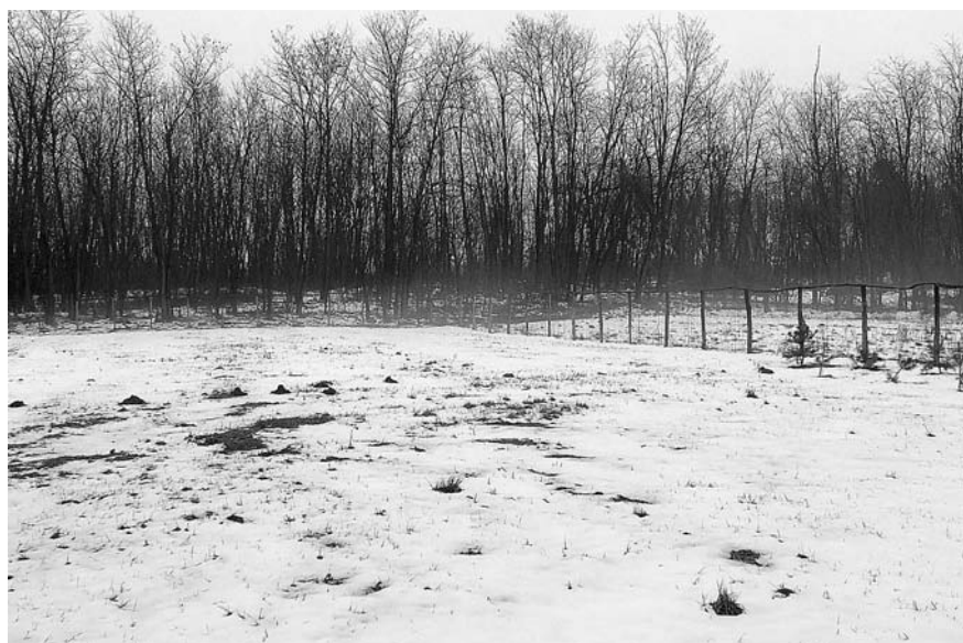
Az erdő előterében látszik az a két telek, amelyeket részben sikerült megvásárolnunk

Legutóbb beszámoltunk arról, hogy a gyermektábor szomszédságában lévő egy hektárnyi sűrű erdőt parkerdővé alakítjuk át. A fakitermelés befejeződött. A gyönyörű óriás tölgyek, bükkök, hársak és égerek jelentik ma az erdőt, amelyet most jó 20 centiméteres hó borít.