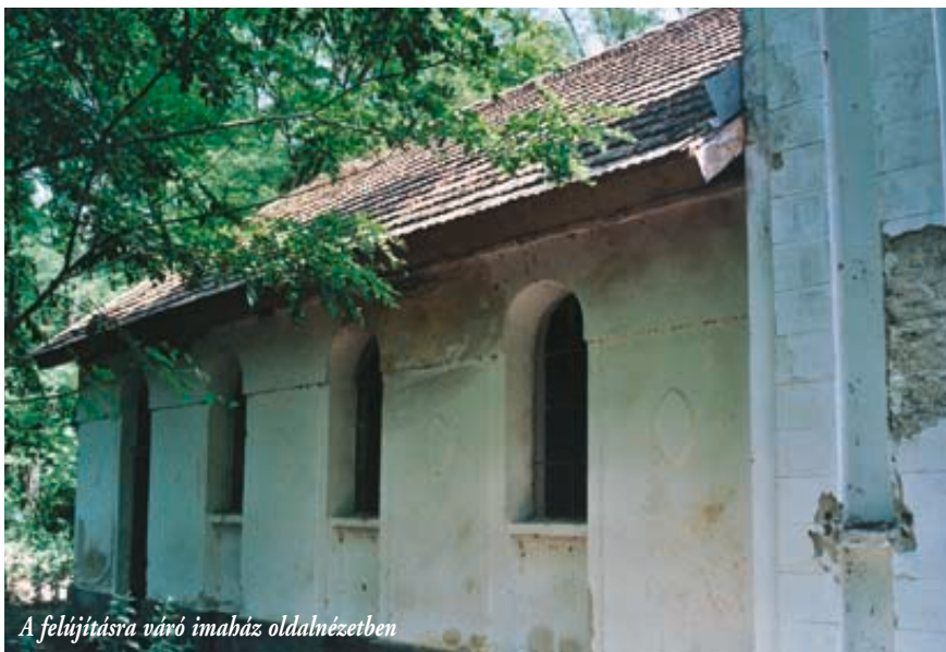
A felújításra váró imaház oldalnézetben