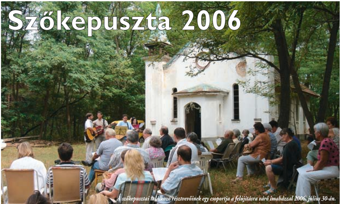
A szőkepusztai találkozó résztvevőinek egy csoportja a felújításra váró imaházzal 2006. július 30-án.