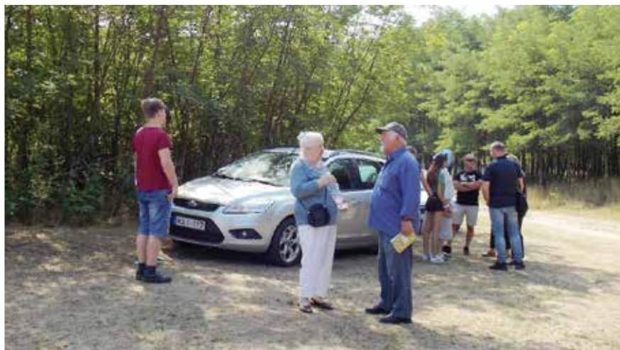
Az első fecskék