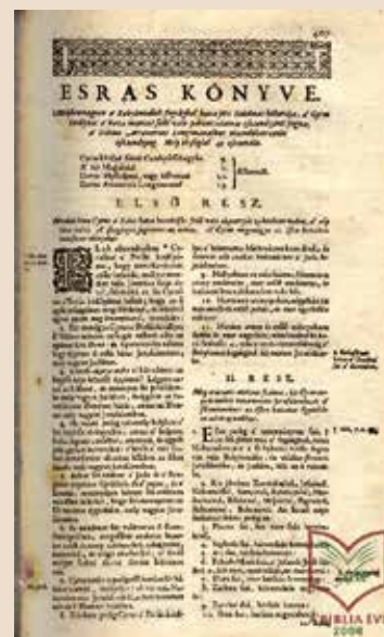
A Váradi Biblia címlapja és egy belső oldala (Esras könyve)