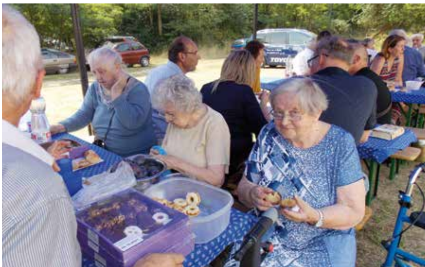
Egy kis sütemény és gyümölcs is előkerült

A gazdag lelki táplálék után következő fontos esemény volt a felállított sátorok alatt. Polgármester úr és családja által készített, nagyon finomra sikerült, felszolgált ebéd: pörkölt tarhonya körettel és savanyúsággal, ásványvízzel és utána kávéval. Ebéd után kötetlen beszélgetések közben sokáig örültünk egymás jelenlétének, és egybehangzó óhajunk, ha Isten is úgy akarja, ugyanitt találkozunk 2022-ben is.