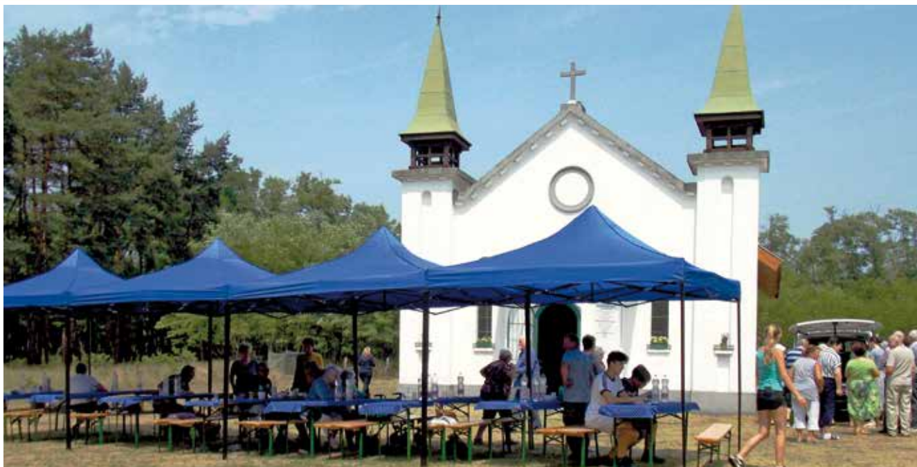
Kezdődik az ebéd