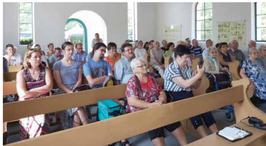
Lassan megtelik a kápolna