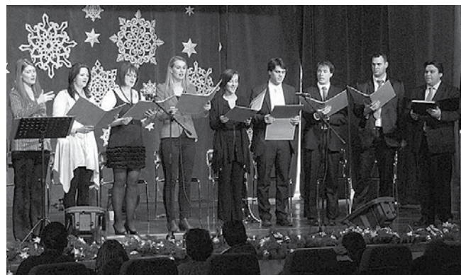
A szolgáló csoport