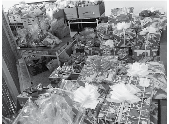
A kiosztásra váró ajándékosztón

Az alkalom a csodaszámba menő, a bibliai ötezer ember megvendéglését idéző kétszáz adag ebéd kiosztásával zárult, amit a koncert előtt egy héttel ajánlott fel egy jószívű adakozó célzottan erre az eseményre. A szolgáló „csapat” lélekben, majd a Dömsődön elfogyasztott ebédnek köszönhetően testi-