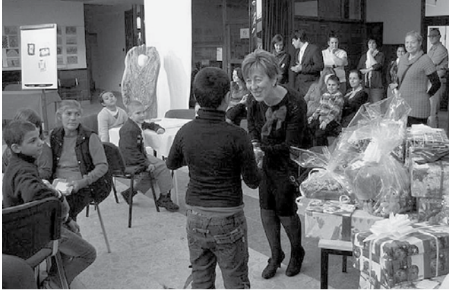
Az ajándékosztás pillanatai

telen a mi koncertünk Kiskunlacházán, nagy és komoly ára volt. Jézus Krisztus emberi testet öltve földre jött, hogy bennünket megváltson, és így adhassuk tovább a jó hírt. Mindennek a lényege ez, nem magunk dicsőségére vagy szórakoztatására szerveztük a hangversenye- ket, hanem hogy azokon keresztül eljuttathassuk az emberekhez a jó hírt.