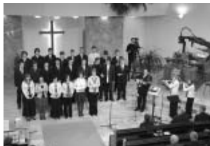
Az ifjúság szolgálata