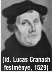
(id. Lucas Cranach festménye, 1529)