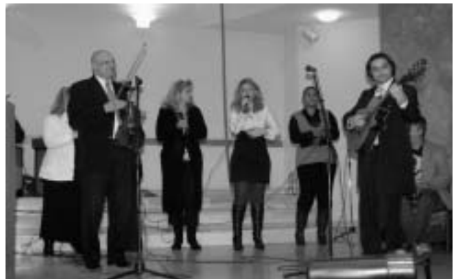
Kezdődik a koncert