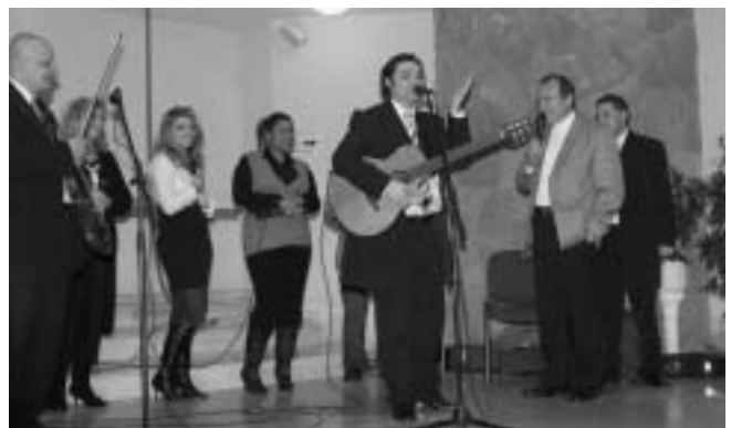
Istené a dicsőség!