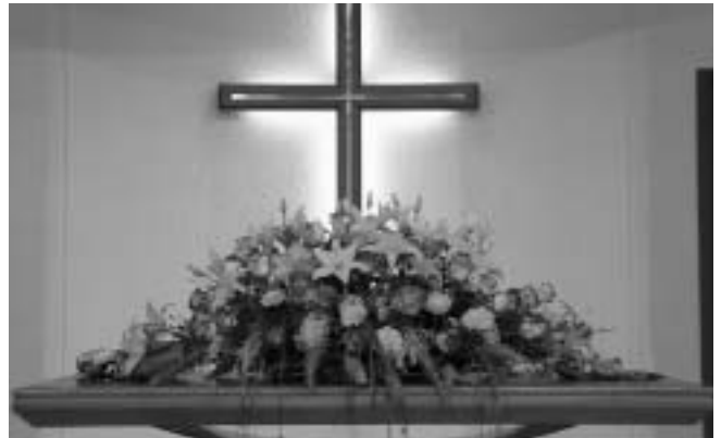
A kereszt virágokkal