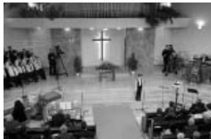
Demeter Robi énekel