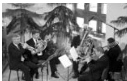
A Rézfűvös Kvintett