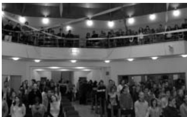
Lassan megtelik a templom