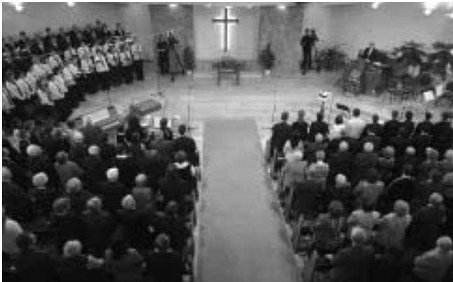
A gyülekezet egy része