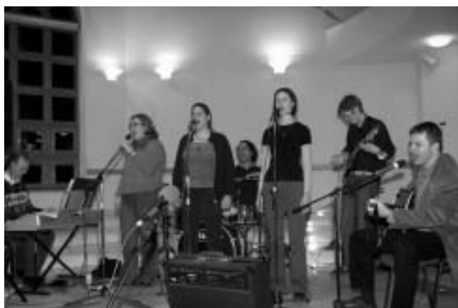
A kecskeméti énekesek és zenészek

Az estét a kecskeméti énekescsoporthoz tartozó zenével. Köszönjük nekik, hogy AKADÁLYaikat leküzdve mégis el tudtak jönni. Hadd folytassam itt a köszönetnyilvánítást gyülekeze-