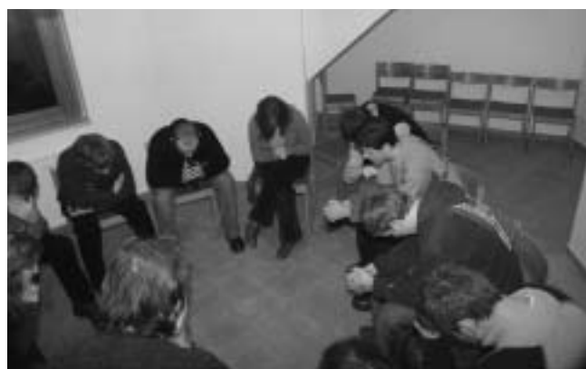
A döntés órája