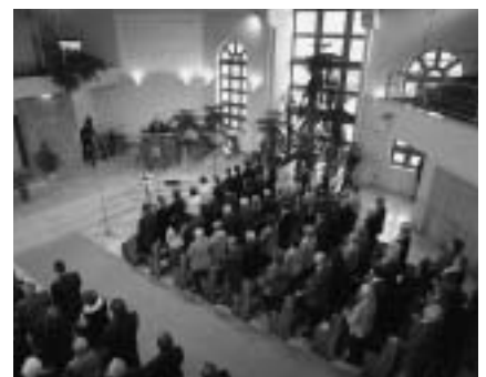
A gyülekezet énekel