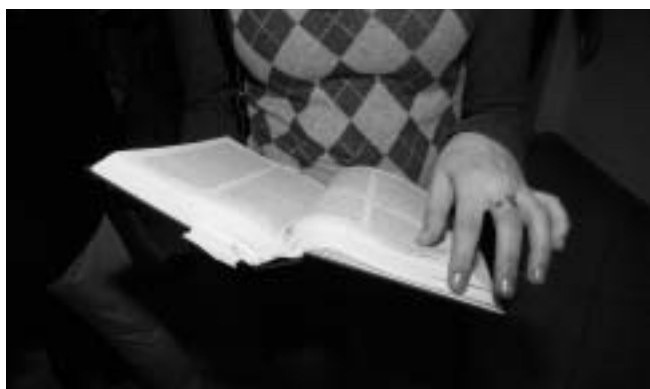
A Biblia most is segít