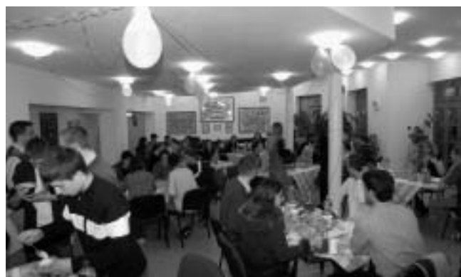
Kezdődik a vacsora