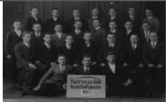
Karvezető tanfolyam, Nap utca, 1932