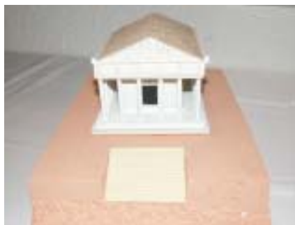
Görög templom Olümpiában