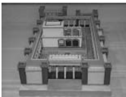
A heródesi templom