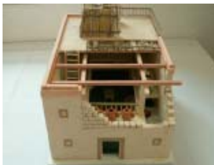
Izraelita ház a bírák korából