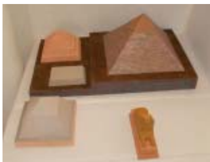
Különböző típusú piramisok