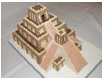
Mezopotámiai zikkurat. Ilyen lett volna Babel tornya