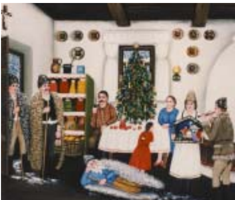
Török János festménye