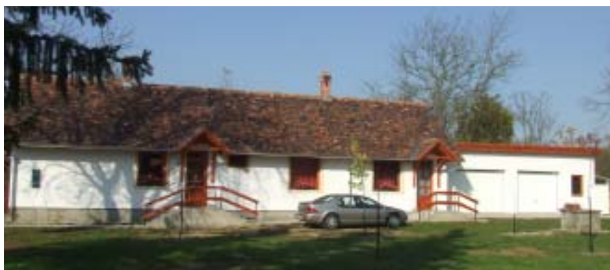
Késő őszi napsütésben még szépek a muskátlis ablakok

Szép fiatal fákat ültettünk. 15–20 év múlva az akkori gyerekek élvezik majd az árnyékukat.