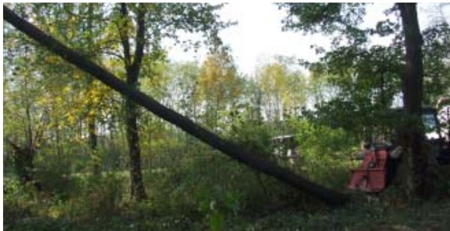
A 15–20 méter hosszú törzseket traktor húzta ki

Ha nem lesz nagy hideg, télen is dolgozni fogunk. Megkezdődött a parkerdő kialakítása. Ez igen nagy munka. Egy hektár területen kellett kivágni a sérült vagy kiöregedett, félig kiszáradt fákat. Olyan erős az aljnövényzet, hogy csak traktoros, láncos fűnyíróval van remény arra, hogy a vadszeder tüskés indáitól megszabaduljunk. A házat téliesítettük. Gyönyörű fákat ültettünk, szelídgesztenye, platán, dió, hárs, és egyéb nagyméretű lombos fák díszítik a telket, ami reménységünk szerint tovább bővül. Most folynak tár-