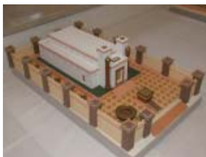
A salamoni templom